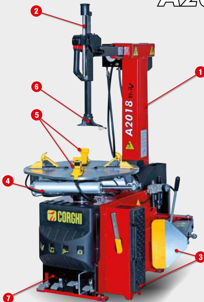
A2018 versión T.I. 2V - A2018 versão T.I. 2V

O funcionamento é automático com o poste basculante pneumáticamente e o mandril de 22" e é adaptado para montar e desmontar rodas de automóveis, veículos comerciais leves e motos.